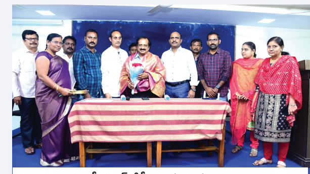
యాష్సీ చైర్మన్, వీసీ లను సన్మానిస్తున్న దృశ్యం